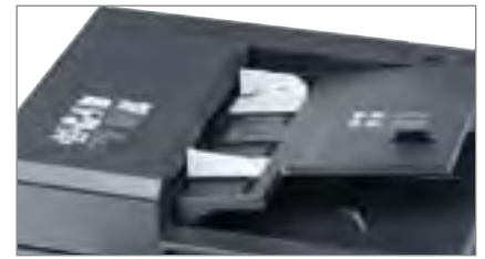
Tempo prima copia molto rapido: 5,7 sec.