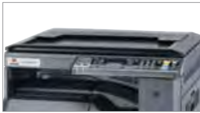
Scanner a colori via TWAIN