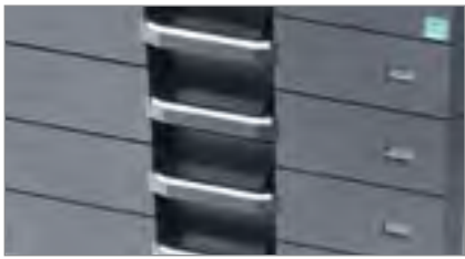
Capacità carta fino a 1.300 fogli